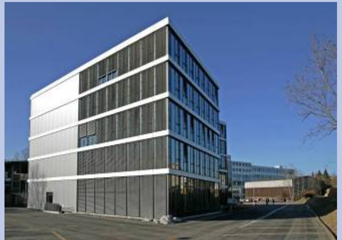
En 2005, Mepha a pu inaugurer un nouvel immeuble de bureaux à Aesch/BL.

Aujourd'hui, Mepha – dont le siège principal se trouve à Aesch/BL – est une entreprise active à l'échelle mondiale, exportant ses produits dans plus de 50 pays d'Europe, du Moyen et Proche-Orient, d'Afrique, d'Asie et d'Amérique du sud. Environ 600 collaborateurs et collaboratrices de tous les pays s'investissent chaque jour avec plaisir au service de nos clients. La distribution des produits en Suisse est confiée à la filiale Mepha Pharma SA. Avec quelque 380 collaborateurs, Mepha occupe le deuxième rang parmi les plus grands employeurs à Aesch/BL.