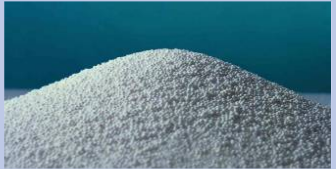
Pellets : une spécialité de Mepha.

La technologie des Pellets fait partie de nos succès les plus importants. Pour certains développements galéniques, nous disposons même de propres brevets. Plus de 20 de nos collaborateurs se consacrent chaque jour à la galénique novatrice des produits Mepha. En 2005, une somme de 22 millions de CHF au total a été investie dans la recherche et le développement de nouveaux produits.